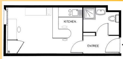
Exemple d'un T1 :